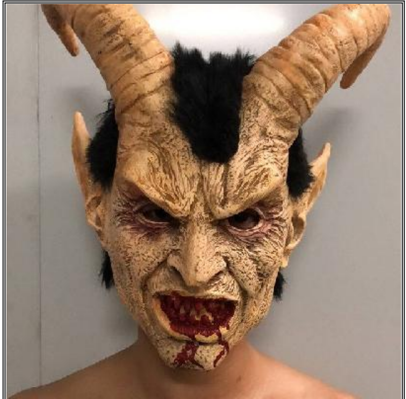
МАСКА НА ДЕМОН ЗА ХЕЛОУИН

ПОДОБНИ МАСОВИ ЕЗИЧЕСКИ, МАГИЧЕСКИ, ДЕМОНИЧНИ ТРАДИЦИИ, КОИТО ОСКВЕРНЯВАТ ПОЧТИ ЦЕЛИЯ БЪЛГАРСКИ НАРОД, ПРЕДИЗВИКВАТ ВЪРХУ НЕГО БОЖИЯ ГНЯВ И БАВНО ГО УНИЩОЖАВАТ СА КУКЕРСТВОТО (ЗАЕДНО С ДЕМОНИЧНИТЕ МУ МАСКИ), НЕСТИНАРСТВОТО, СУРВАКАРСТВОТО, КОЛЕДУВАНЕТО, КОРБАНДЖИЙСТВОТО, ЛАЗАРУВАНЕТО, ЛАДУВАНЕТО, ХАМКАНЕТО, ТРИЧАНЕТО, ЕНЪОВ ДЕН, ПОЛАЗНИК, БЪДНИК, ПРОЩЪПУЛНИЦИТЕ, МАРТЕНИЦИТЕ, БАНИЦИТЕ С „КЪСМЕТИ“, КОЛЕДНИТЕ ЕЛХИ, ЛЕЕНЕТО НА КУРШУМИ, ХОРОСКОПИТЕ, ЗОДИИТЕ, ТАЛИСМАНИТЕ, АМУЛЕТИТЕ, РОЗЕТИТЕ, РУНИТЕ, ЙЕРОГЛИФИТЕ И ДРУГИ ПОДОБНИ БЕСОВСКИ, ОМАГЪОСВАЩИ ПРАКТИКИ.