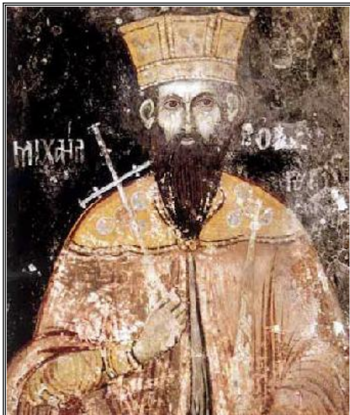
Свети цар Борис I Михаил. Стенопис на манастира "Свети Архангели" (Свети Наум), на Охридското езеро. Ктитор на манастира е Борис I

ЗАТОВА ДНЕС БЪЛГАРИТЕ И БЪЛГАРИЯ, БЕЗ ДА СА ВИДИМО ЗАВЛАДЯНИ, БАВНО ЗАГИВАТ.