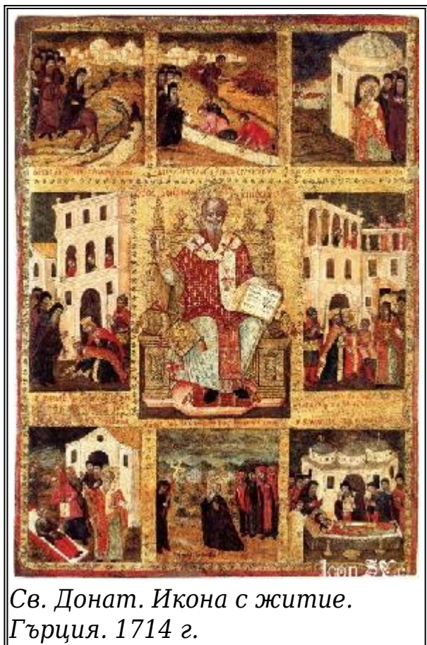
Св. Донат. Икона с житие. Гърция. 1714 г.

С вети Донат живял през царуването на император Теодосий Велики и бил епископ на град Еврия, който се намирал в днешния Епир. Наблизо край този град имало едно място, наречено Сория, където имало извор на вода. Ако някой пийнел вода от извора, веднага умираше в страшни мъки. Епископ Донат научил за това и отишъл там със своите клирици.