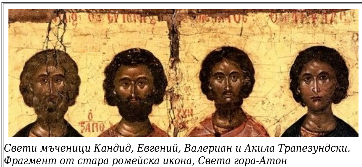
Свети мъченици Кандид, Евгений, Валериан и Акила Трапезундски. Фрагмент от стара ромейска икона, Света гора-Атон

Т ези свети прославени мъченици пострадали при царуването на Диоклетиан и Максимиан от управителя Лизий. Светите Валериан, Кандид и Акила били хванати в Трапезундските планини, защото, когато започнало гонението, те оставили домовете, имуществото си и целия суетен свят, и се скитали в планините, предпочитайки да живеят със зверовете, отколкото с богопротивните идолопоклонници. Нечестивците най-напред изпратили тримата мъченици в градчето Пина, в Ласийската страна, където ги затворили в местната тъмница, а след някое време отново ги довели в Трапезунд и ги изправили пред управителя Лизий. Когато започнали да разпитват светиите за Христовата вяра и да ги принуждават да принесат идолски жертви, те не