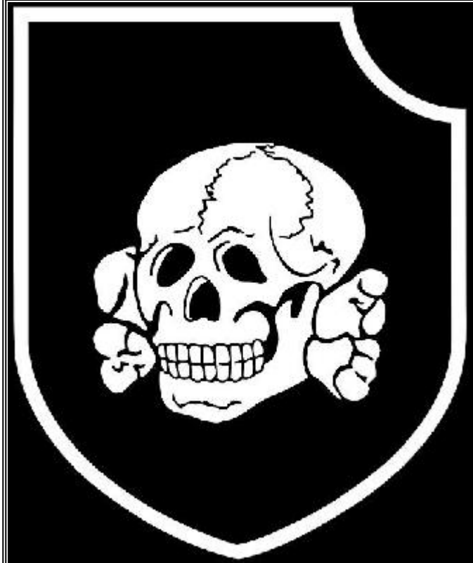
Эмблема Третьей дивизии СС "Мертвая голова"

ОЧЕНЬ СИМВОЛЕСКОЕ ЗНАЧЕНИЕ ИМЕЕТ ТО ЧТО ПРИГОТОВЛЕНАЯ ДЛЯ МАССОВЫХ ЖЕРТВ В ПЛАНИРУЕМОЙ