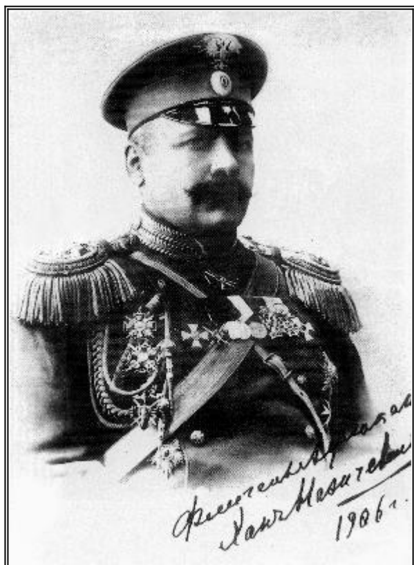
Генарал-адютант Хан Нахичевански

Една от другите подобни телеграми е изпратена от командващия Гвардейските кавалерийски корпуси, произхождащия от владетелски фамилии, кавалер на 20 руски и 9 международни ордена, генарал-адютант Хан Нахичевански: