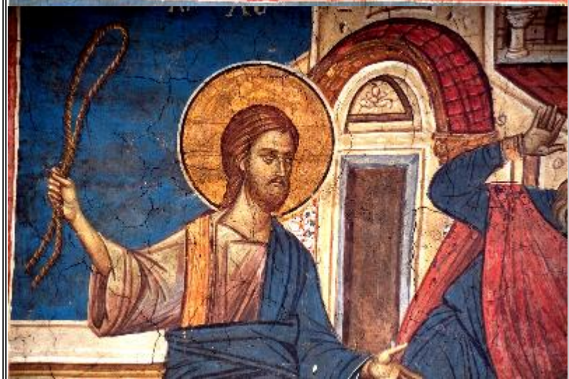
Изгонване на търговците от храма. Стенопис от манастира Високи Дечани. Косово. Сърбия. До 1350 г.

НЕ ТРЯБВА ДА ЗАБРАВЯМЕ И ОТНОШЕНИЕТО НА САМИЯ СПАСИТЕЛ КЪМ ЖИДОВЕТЕ ТЪРГАШИ: