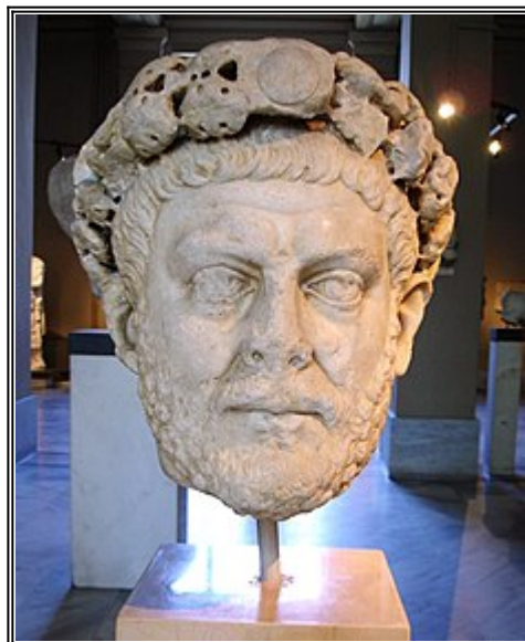
Император Диоклетиан. Управлявал империята от 284 г. до 305 г.

- Казвам ви истината - не мога вече да предсказвам бъдещето, защото тук на земята ми пречат праведните човеци, които унищожават нашата сила, за това и лъжат в капищата вълшебните триножници (4).