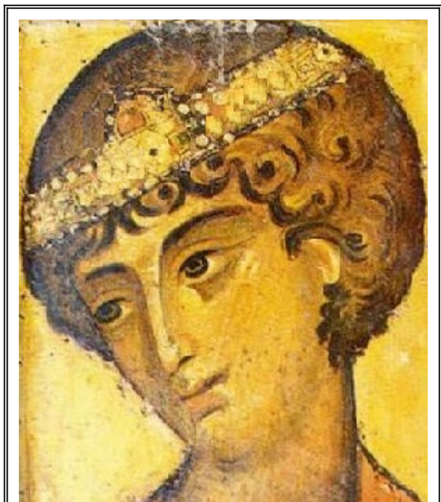
Свети Георгиев Победоносец. Стара ромейска икона от Синай

се преселила заедно с него в Палестина, понеже била родом от тия страни и притежавала огромни наследствени богатства.