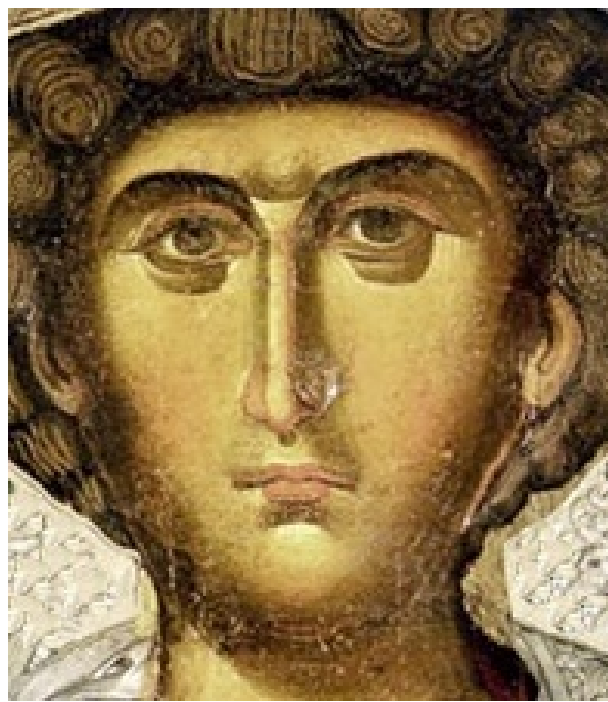
Фрагмент от Фануилската самоизписала се чудотворна икона на свети Георгий. Света Гора-Атон

06.05 по еретическия, †23 април по православния календар - Свети великомъченик Георгий Победоносец. Света мъченица царица Александра