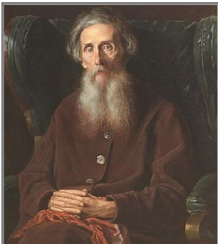
Владимир Иванович Дал

Показателно е, че малко след издаването на книгата Ариел Тоаф е принуден да я изтегли от продажба, за да я преработи и да прекрати преподавателската си дейност.