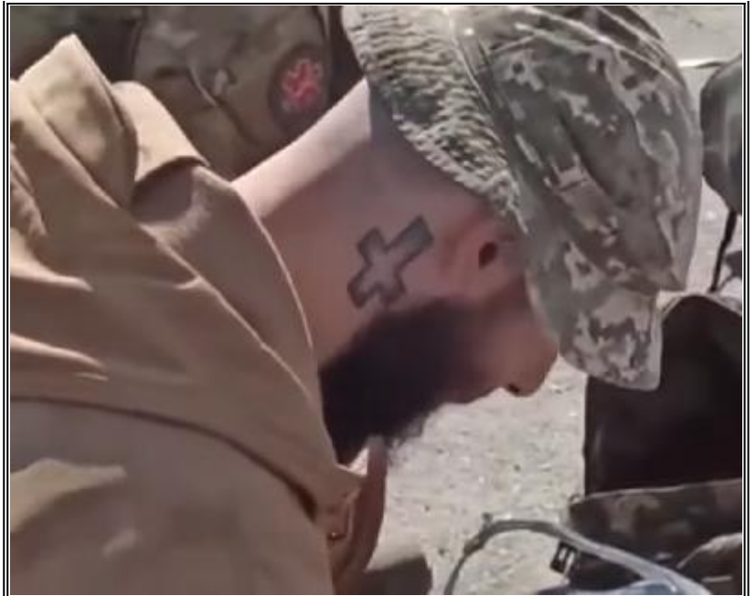
Снимки на нацията сатанисти от "Азов"

Не случайно, вече след началото на „СВО“, Путин освободи много нацисти от полка „Азов“, пленени след атаката на „Азовстал“. Това беше поредна гавра и подигравка на хабадника антихрист, който уж обяви, че войната се води за „денацификация“ на Украйна, а в същото време освобождава точно хора от ядрото на наци лумпените – сатанисти, нашарени с татуировки на демони, които са масови убийци на славяни и са платени слуги на другите христоненавистници - хабадските жидове Коломойски, Ярош и Зеленски.