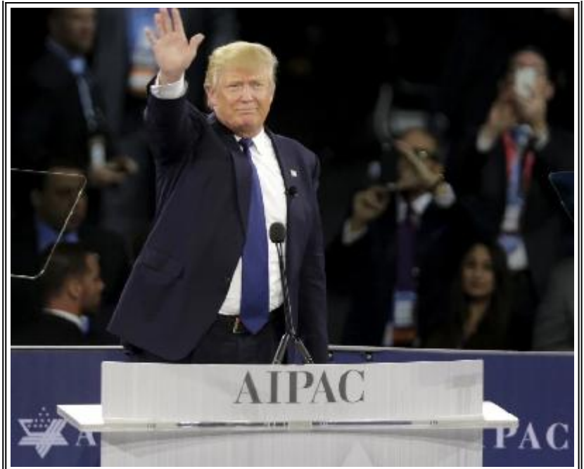
На снимките: Американски политици на Евромайдана и Тръмп поздравява сборище на AIPAC с характерен жест

Това мероприятие се посещава също така и от политици, сенатори и конгресмени на САЩ (които разбира се, както и Тръмп, са пряко подчинени на AIPAC (American Israel Public Affairs Committee – Американско-израелски комитет по обществени въпроси), която е най-влиятелната организация на еврейското лоби в САЩ).