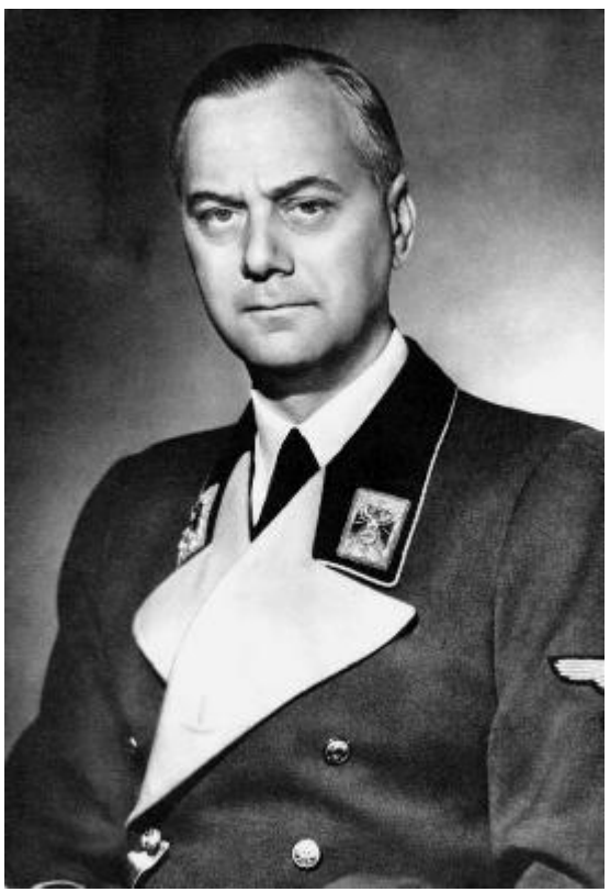
Евреина идеолог на националсоциализма Алфред Розенберг

Относно идеолога на нацизма Алфред Розенберг – Журналиста Франц Зел, който пребивава в Тилсит, Прусия, прекарва една година в търсене в латвийски и естонски архиви, преди да публикува през 1936 г. отворено писмо с копия до Херман Гьоринг, Йозеф Гьобелс, германският външен министър Константин фон Нойрат и други, обвиняващо Розенберг, че няма "капка немска кръв", която тече във вените му. Зел пише, че сред предците на Розенберг са само "ЕВРЕИ, латвийци, монголци и французи". В резултат на отвореното си писмо, Зел е депортиран от литовските власти. Неговите твърдения са повторени в изданието от 15 септември 1937 г. на Ватикана L'Osservatore Romano. (Staff (March 2008) "Szell, Franz (fl 1936-1937): correspondence regarding Alfred Rosenberg" (catalog entry) Wiener Library Quote: "Franz Szell, an exiled Hungarian journalist apparently resident in Tilsit, Lithuania spent more than a year in the archives in Latvia and Estonia researching Alfred Rosenberg's family history with a view to publishing the