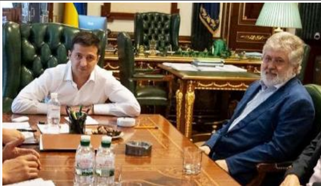
На снимките: Коломойски със своите юдейски хабадски братя - главния равин на Русия Берл Лазар и президента на Украйна Зеленски