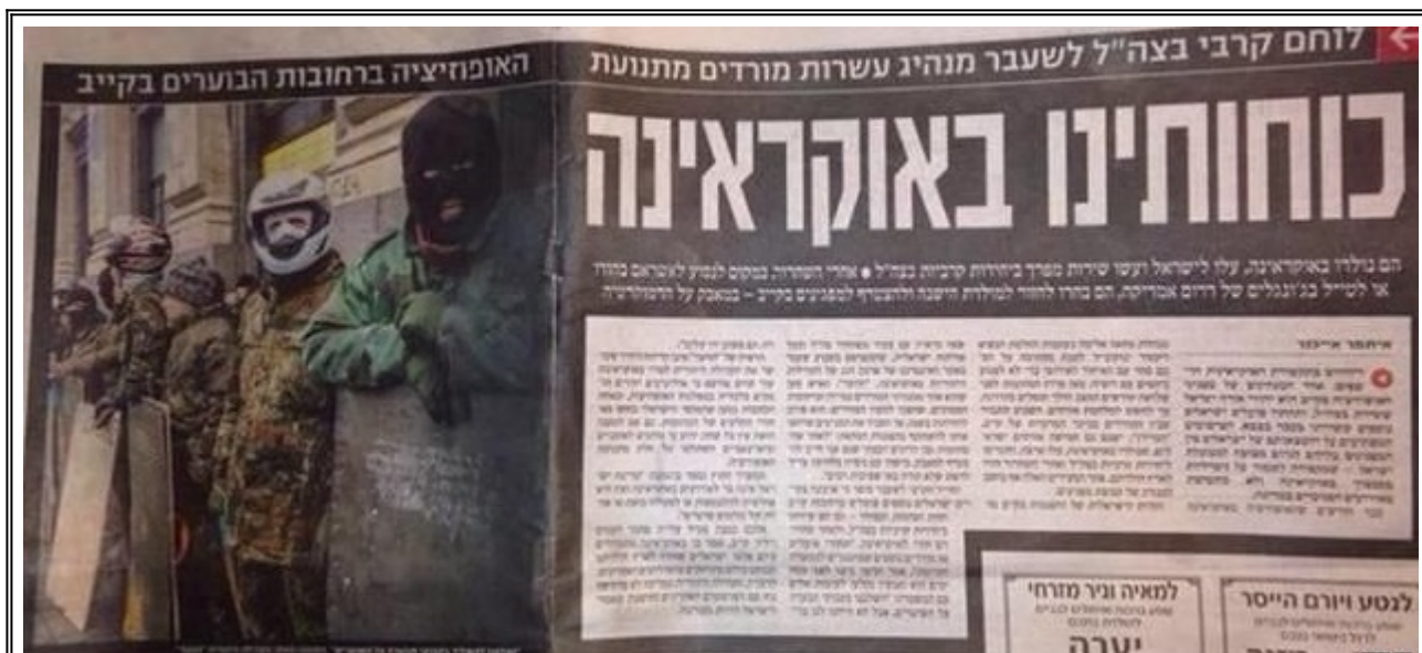
Статия в израелския вестник "Едиот Ахронот", озаглавена " Офицер от ЦАХАЛ и още 300 еврейски бойци станаха инструктори на Майдана "

П редварително заложеният юдейски политически и военен сценарий за мащабно жертвоприношение ясно проличава, когато се види ролята на самата Русия в успеха на Майдана, смяната на властта в Украйна и последвалата няколкогодишна гражданска война, с десетки хиляди жертви, която прерастна в широкомащабна междуславянска война с вече близо 2 милиона убити и ранени.