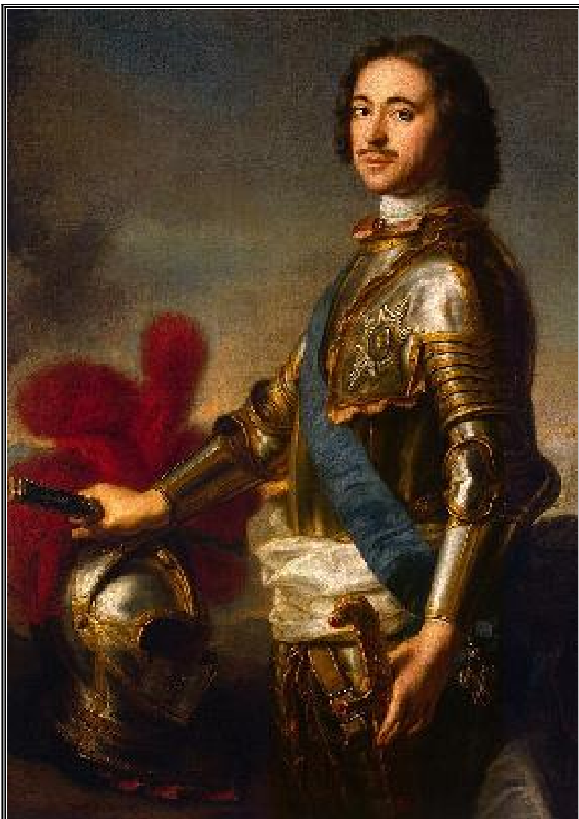
Портрет на Петър I в западни РИЦАРСКИ доспехи, нарисуван от професора на Френската кралска академия по живопис и скулптура Жан-Марк Натие

Петър I издава и указ, с който задължава светските лица да си бръснат брадите. Целта е да въвежда духовните мерзости на западните католически и протестантски еретици, лишавайки руснаците от възможност да следват образа на Иисуса Христа, завещан от Свещеното Предание чрез светите икони.