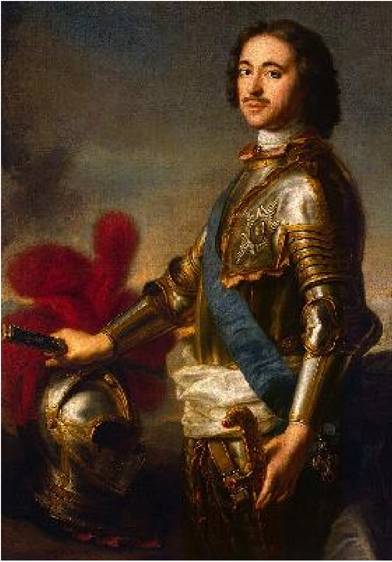
Портрет Петра I в западных РЫЦАРСКИХ доспехах, написанный профессором Французской Королевской академии живописи и скульптуры Жан-Марк Натье

Можно найти истории о том, что древние кельты (в других источниках — германцы) в день зимнего солнцестояния приносили кровавые жертвы лесным духам , чтобы те позволили им пережить холода. Юных девушек убивали, а их внутренности развешивали на самой большой ёлке в лесу в качестве подношения силам природы. Со временем от праздничные жертвоприношения отказались, заменив вырванные органы