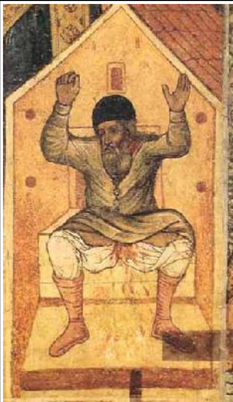
Кончината на Арий