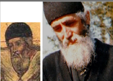
Интересна е дори физическата прилика между двамата еретици

Стигна до там да ходи до тоалетната по деветнадесет пъти за една нощ, без да има нужда - изхвърляше само кръв. Лекарите не знаеха на какво точно се дължат кръвоизливите... (подобно на мъките на Арий, но без достигане на фаталния край, все още. Многократни предупреждения за вразумление, които така и не са обърнали упорития, изпаднал в прелест еретически лъжесветия - б.р.).