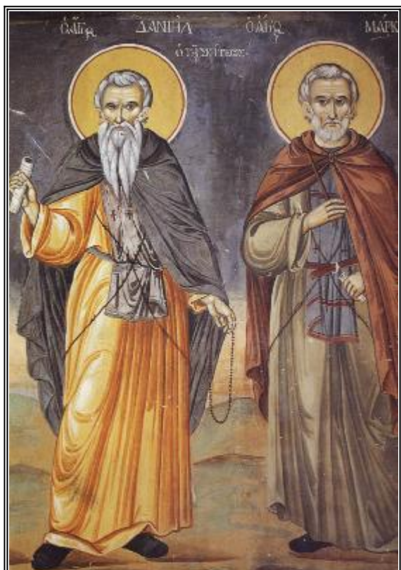
Светите преподобни Данил и Марк Постник. Фреска от Атон, манастир Ватопед. 1802 г.

Т ози свят подвижник надминал всички монаси със своя постнически живот. Наред с това се отдал на изучаване на Божествените Писания и достигнал съвършенство в добродетелта, както свидетелстват за това написаните от него поучения, извършил много чудеса. Душевната чистота на преподобния била толкова голяма, че манастирският