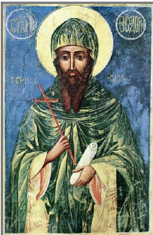
Св. прподобни Теодосий Търновски. Българска икона от XIX в.

П реподобният Теодосий се роди от благочестиви и благородни родители българи, както се предполага, в град Търново, който тогава беше столица на българите. Понеже още