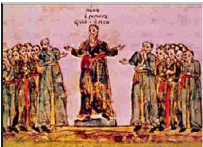
Полемика с еретиците