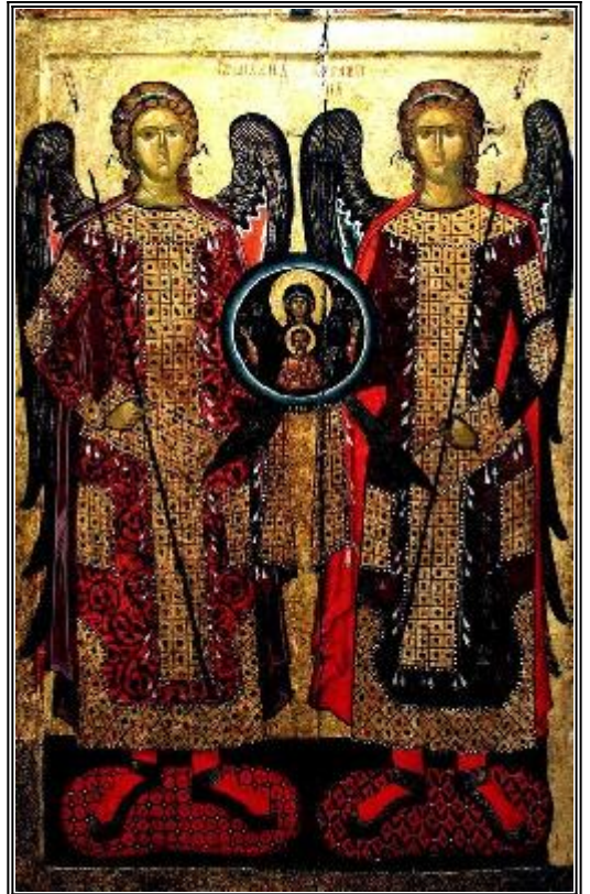
Светите Архангели Михаил и Гавриил. Българска икона от Бачковския манастир. XIV век

Деветте ангелски чина се разделят на три иерархии - висша, средна и низша, във всяка от които има по три чина.