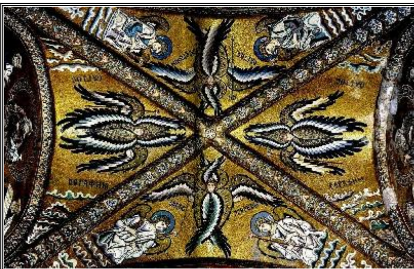
Ангели Господни, Серафими и Херувими. Византийска мозайка от катедралата в Чефалу, Сицилия. Около 1166 г.

Деветте ангелски чина се разделят на три иерархии - висша, средна и низша, във всяка от които има по три чина.