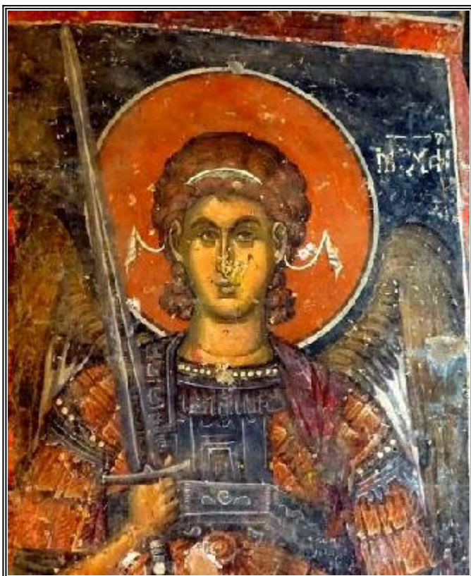
Свети Архангел Михаил. Стенопис от църквата "Свети Николай" в село Псача, област Македония. 1365 - 1377 гг.

Събор на свети архистратиг Михаил и другите небесни безплътни сили