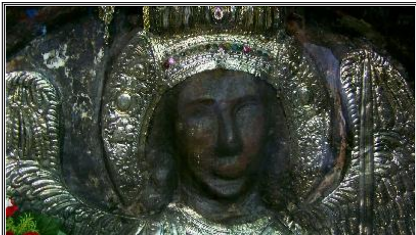
Чудотворната релефна икона на св. архангел Михаил. Вижте интересни подробности по-долу в материала

тогава било установено благочестивото и правилно тяхно почитане, каквото подобава на Божиите служители и пазители на човешкия род. И в същата тази Колоска страна, където преди тайно и нечестиво се извършвало почитанието на ангелите, започнало открито да се извършва православно празнуване на Събора на ангелите и започнали да се строят великолепни храмове в чест на светия архистратиг Михаил - началника на ангелите. Така в Хони, над чудотворния извор, бил построен благолепен и пречуден храм, в който на свети Архип се явил сам светият архистратиг Михаил. Празникът, посветен на Събора на светите ангели, е постановено да се извършва в месец ноември - деветия след месец март, първият месец от сътворението на света - като обозначение на числото на ангелските чинове, които се считат за девет от свети Дионисий Ареопагит, ученика на свети апостол Павел, който като бил възнесен до трето небе, видял различието на чиновите на светите ангели и го обяснил на Дионисий като на свой ученик.