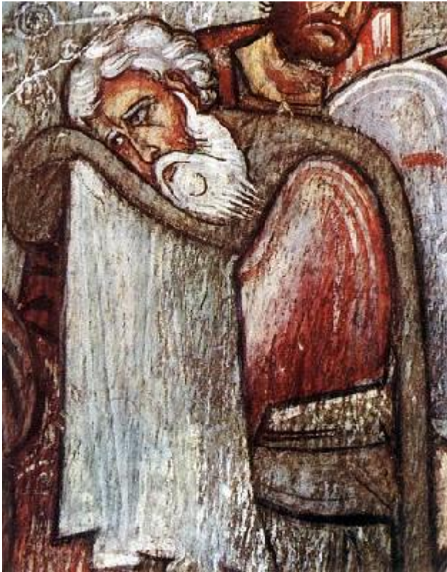
Страдание на свети апостол Матей

22.08 по еретическия, †09 август по църковния календар - Св. апостол Матей. Св. мъченик Антоний. Св. мъченици Иулиан, Маркиан и на другите, пострадали с тях за светите икони. Св. преподобни Псой