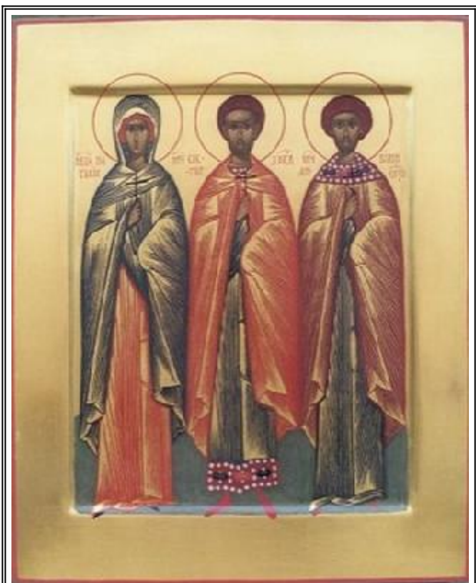
Свети мъченици Виктор Халкидонски, Наталия, Антоний Александрийски