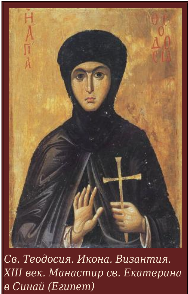
Св. Теодосия. Икона. Византия. XIII век. Манастир св. Екатерина в Синай (Египет)

видял това, мъчителят заповядал най-напред да обгорят лицата им с нажежени жезла, а после да ги изведат на площада и да ги убият с меч. Така завършили страданията си светиите. Заедно с тях, заради благоговейното си почитане на иконите, била посечена и една знатна жена на име Мария Патрикия. Телата на светите мъченици били хвърлени в морската дълбина.