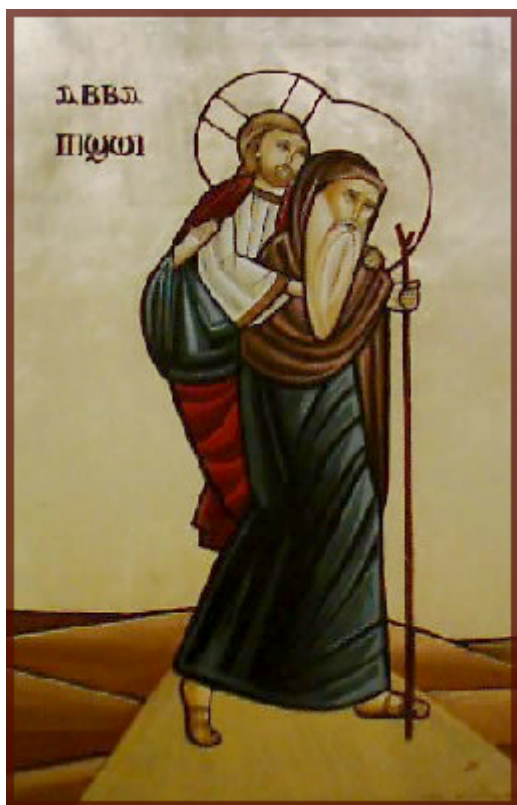
Преподобный Псой Египетский (IV в.)

Преподобный Псой был ученик преподобного Пахомия Великого и подвизался в IV веке в Египетской пустыне.