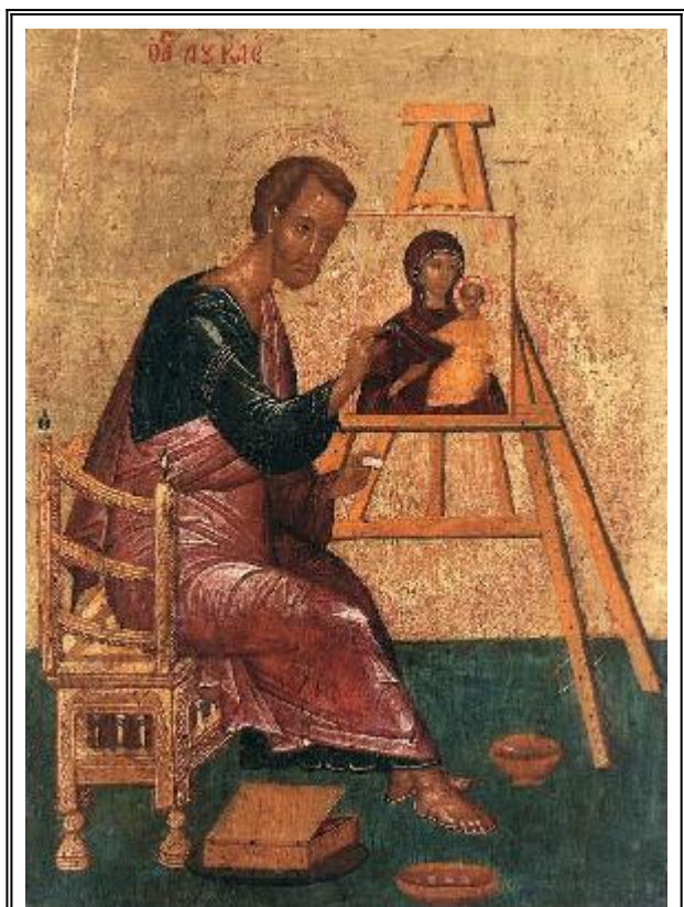
Свети апостол и евангелист Лука рисува икона на Богородица с Младенеца. Стара руска икона

(23) Свети Андрей Първозвани бил един от 12-те апостоли, а свети Тимотей - един от 70-те Христови ученици, бил епископ на град Ефес в Мала Азия.