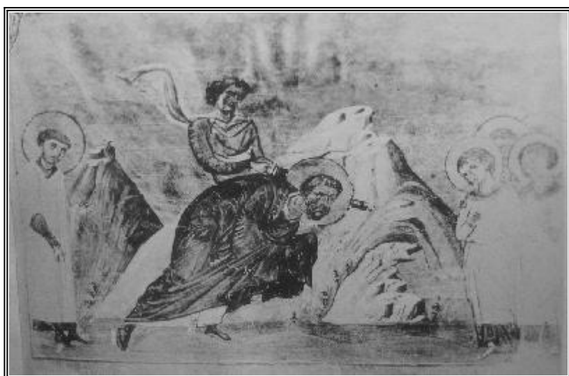
Св. свещеномъченици Фавст презвитер, Авив дякон и сподвижниците им. Миниатюра от минологията на Василий II. Константинопол. 985 г.