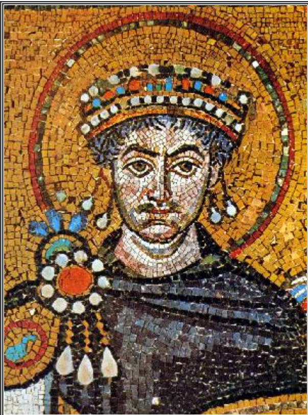
Свети цар Юстиниан, фрагмент от мозайка. Равена (Сан-Витале). 532-547 гг.

Българската аристокрация на Византия (или как свети цар Юстиниан изобличи лъжеисториците и лъжеправославните)