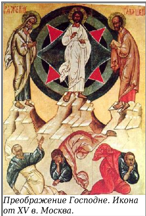
Преображение Господне. Икона от XV в. Москва.

П риближавайки се към доброволните страдания заради нашето спасение, нашият Господ Иисус Христос започнал да говори на учениците си, че “трябва да отиде в Иерусалим и много да пострада от стареите, първосвещениците и книжниците и да бъде убит”; Той казал това в Кесария Филипова, след като апостол Петър изповядал, че Той е Христос, Син на Живия Бог, - “Ти си Христос, Синът на Живия Бог”. Вече течала последната година от тригодишната проповед на Иисуса Христа и тридесет и третата година от раждането Му от Пречистата Дева. Христовите думи силно опечалили учениците, и особено апостол Петър, който започнал да възразява на Господа, казвайки: “милостив Бог към Тебе, Господи! това няма да стане с Тебе”. Забелязвайки скръбта на учениците и желаейки да я облекчи, Иисус Христос обещал на някои от тях да им покаже Своята слава, в която ще се облече след отшествието Си: “тук стоят някои - казал Той, - които няма да вкусят смърт, докле не видят Сина Човечески да