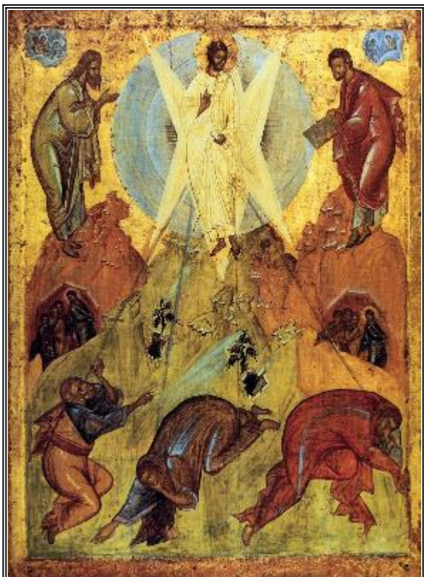
Преображение Господне. Икона от XVIII в. Москва.