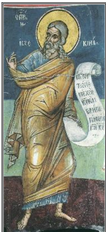
Св. пророк Йезекил. Фреска от Атон, манастир Дионисиат. 1547 г.

Житие на свети пророк Йезекиил (VI в. пр.Хр.)