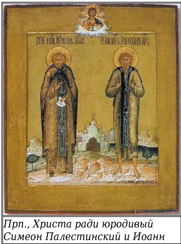
Прп., Христа ради юродивый Симеон Палестинский и Иоанн