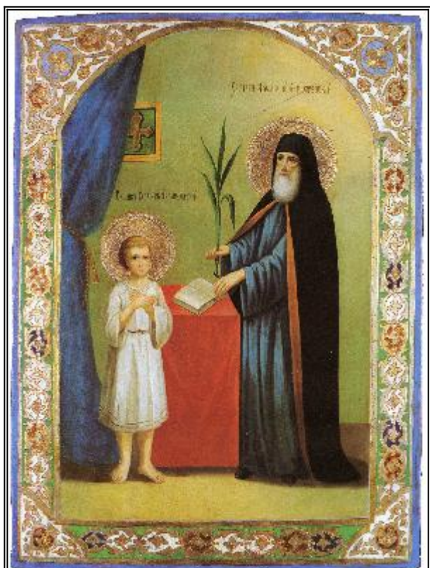
Светите Гаврил Заблудовски и Атанасий Брестски. Икона от Краеведчески музей, Белосток. Края на XIX в.

Преподобномученик Афанасий Брестский, игумен (1649 г.)