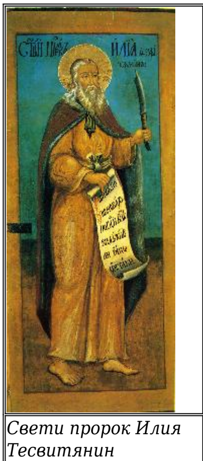
Свети пророк Илия Тесвитянин

Народът изпълнил заповедта му и Илия ги отвел при потока Кисон, който се вливал с водите си във Велико море. Там той ги изклал със собствените си ръце и хвърлил нечестивите им трупове във водата, за да не се оскверни с тях земята и за да не се зарази въздухът със смрад от тях. След това свети Илия наредил на цар Ахав побързо да пие и да яде и да впряга конете в колесницата, за да тръгне на път, защото скоро ще завали силен дъжд, от който всичко ще подгизне. Когато Ахав седнал да яде и да пие, Илия се изкачил на планината Кармил. Като се навел към земята, той сложил лицето си между коленете и се помолил на Бога да изпрати дъжд на земята. Веднага след молитвата му небесата, като с ключ, се отворили и паднал голям дъжд, който намокрил всички и обилно напоил зажаднялата земя. Тогава Ахав, като осъзнал заблудението си, по пътя към Самария оплаквал греховете си. А свети Илия, като препасал кръста си, тичал пред него, като се радвал за славата на Господа, своя Бог.