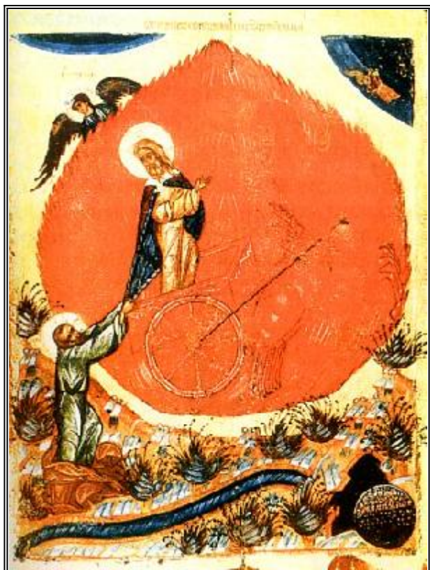
Огненото възхождение на свети славен пророк Илия. Руска икона от XVII век. Ярославл.

Както вървели и разговаряли, внезапно се явила огнена колесница и огнени коне и ги разделили един от друг, при което Илия във вихрушка бил взет на небето. А Елисей гледал и възкликнал: