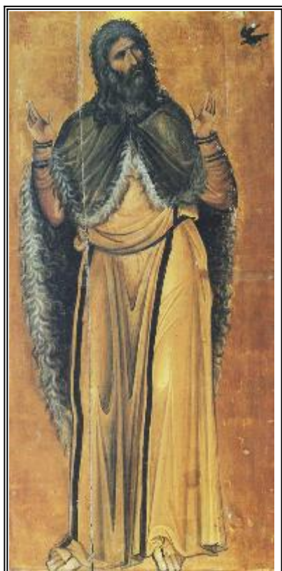
Свети славен пророк Илия. Икона от Византия. XIII век. Манастир "св. Екатерина" на Синай.

Житие и чудеса на свети пророк Илия (IX в. пр. Р.Х.)