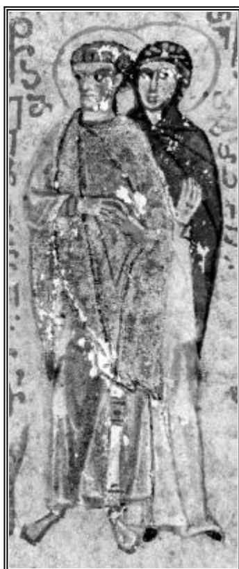
Свети Емилиан Доростолски и св. Теодосия. Миниатюра от Атон - Иверски манастир. Края на XV в.

Страдание на свети мъченик Емилиан (363 г.)