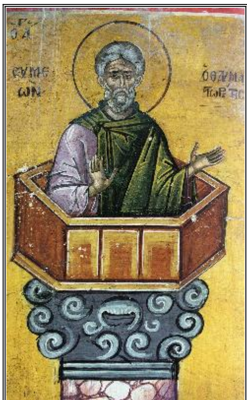
Преподобни Симеон. Фреска. Атон (Дионисиат). 1547 г.

Е дин младеж, на име Иоан, заедно с родителите си дошъл от Едеса в Антиохия. Иоан бил вече на възраст за женене и затова родителите му, като видели тук една твърде красива девойка, на име Марта, поискали съгласието на нейните родители да дадат дъщеря си за жена на техния син.