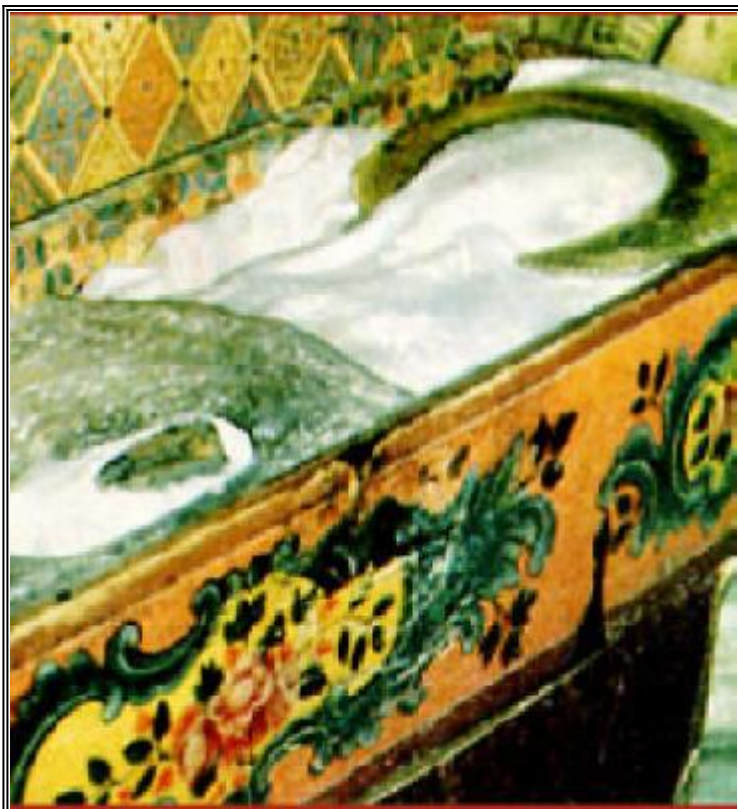
Раклата с мощите на Св. Иоан Рилски в Рилския манастир

След това, като тръгнаха оттам и изминаха около половин поприще от това място, ги срещна цялото братство на светата обител с икони и честен кръст на мястото, наречено Върбица, малко по-долу от съединението на двете реки Рила и Илиина, и там образуваха хор заедно и пяха божествени песни, целуваха светинята и един друг, и оттам всички заедно пристигнаха в манастира. И като внесоха ковчега на преподобния в църквата с много почести и псалмопение, поставиха го на приготвеното място на 30 юни 1469 г., където и досега лежи и е непресъхващ извор на изцеления за пристъпващите с топла вяра.