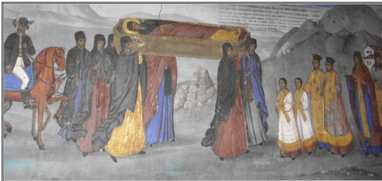
Възвръщане на честните мощи на преп. Иоан Рилски чудотворец

Като чуха хората от околността за пристигането на светеца, събраха се на река Герман в някакво село, на разстояние от манастира около ден и половина път, и там го чакаха. Но и манастирският игумен, когато узна, че светецът се приближава, вдигна се със своите подчинени, които бяха по това време в манастира - свещеници и братя, и като взеха свещи и най-благоуханни кадила, срещнаха го с почести в споменатото село и почиваха на онова място ден и нощ. Сутринта, като запалиха свещи и кадила и като произнесоха молитва, сам игуменът със свещеници взе мощите на светеца и вървеше пред ковчега, като се радваше и пееше, както някога богоотец Давид пред ковчега на завета. И така вървяха пеша с целия народ до голямата планина Рила. Когато стигнаха до подножието на планината, игуменът заповяда да седнат и да вкусят храна, за да не се изтощат някои от неядене. И така полегнаха хората по зелената трева, както някога при чудесата на Христа. И там поставиха знак в името на светеца, където и досега всяка година на празника хората правят тържество.