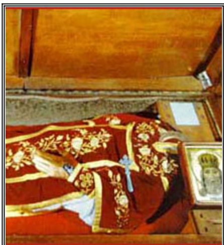
Раклата с мощите на Св. Крал Стефан Милутин в църквата Св. Неделя в София

светеца, което не престана да тече оттогава през всичките дни и нощи. Споменатият велможа надари богато носещите ковчега на преподобния и ги снабди предоволно с нужното за път, а те положиха носилото на светеца върху животното, той пък ги изпрати чак до река Осъм заедно с тамошните боляри. И там, като прегръщаха ковчега на светеца и се поклониха на монасите, връщаха се всеки у дома си, като се обръщаха назад.