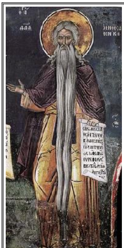
Преподобни Давид Солунски. Фреска от Атон, манастир Дионисиат. 1547 г.

Паметта на преподобния наш отец Давид Солунски (VI в.)