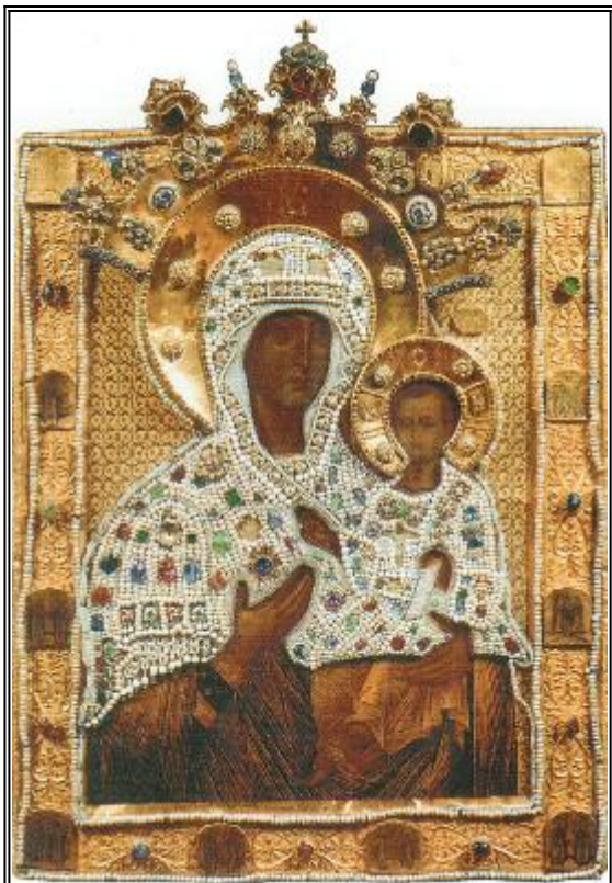
Смоленска икона на Божията Майка. 1456 год.

И звестно време след слизането на Светия Дух над Апостолите, свети Апостол и Евангелист Лука, който бил изкусен иконописец, нарисувал върху дъска образа на Пресветата наша Владичица Богородица и го занесъл на Самата Пречиста Дева. Като погледнала изображението на Своя лик на иконата, Пречистата си спомнила своето предишно пророчество за Себе си и казала: “отсега ще ме облажават всички родове”. После, посочвайки иконата, казала: “нека моята благодат да бъде с тази икона.” И тези думи на света Богородица се изпълнили в действителност: по благодатта на Преблагословената Дева, от тази икона произтичали много различни и неизказани чудеса, а на страдащите се давало изцеление.