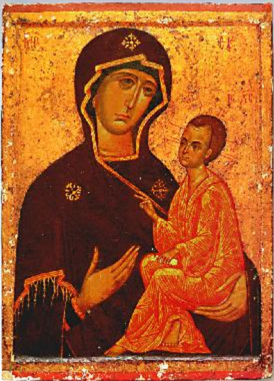
Първообраз на чудотворната Тихвинска икона на Пресвета Богородица (с обков и без обков), който се намира в Тихвинския манастир

В 6891 година от сътворението на света, или в 1382 от