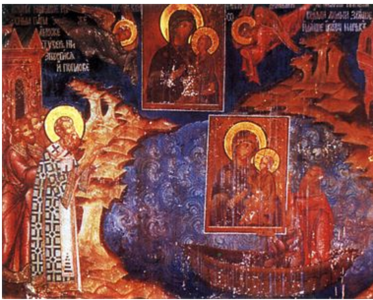
Патриарх Герман спуска в морето Лидийската икона на Богородица, за да я спаи от иконоборците

С тези думи светейшият Герман целунал иконата с любов и я спуснал в морето.