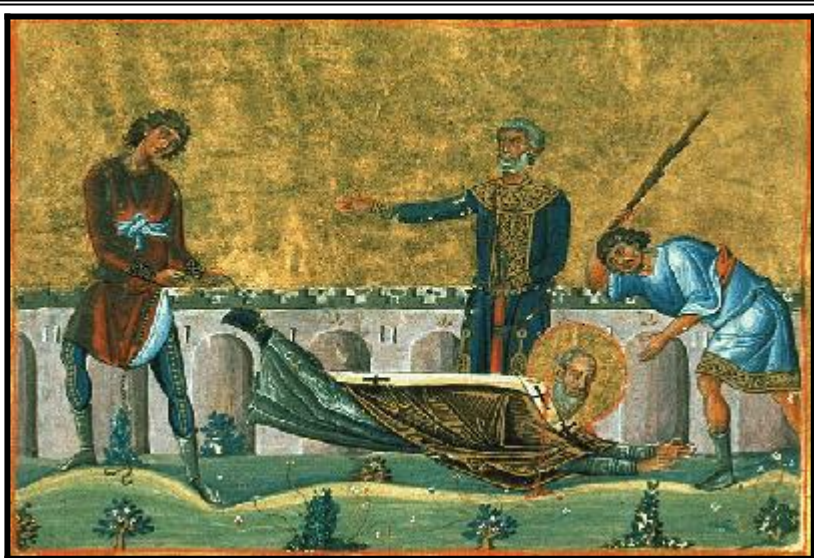
Мъчение на свщмч. Доротей. Миниатюра от Минологията на Василий II. Константинопол. 985 г.

на Тирската църква, избягвайки по този начин от ръцете на мъчителите; защото Господ е заповядал да не се предаваме на явни беди от страна на гонителите, но да ги избягваме; Той е казал: “А кога ви пъдят от един град, бягайте в друг”.