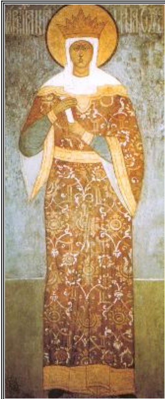
Св. равноапостолна княгиня Олга. Фреска от Московския Кремъл - Архангелски събор. XVII в.

... В Русия има и друг древен град, наречен при създаването си ПЛИСКОВА (на старославянски Плъсковъ) - Това е днешния Псков.