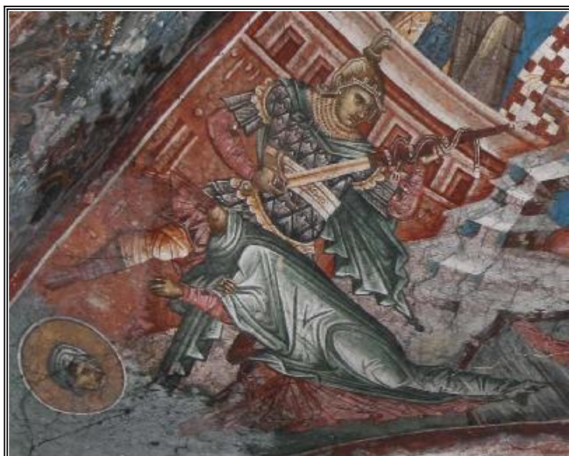
Мъчение на св. Еликонида. Фреска. Църква Христос Пантократор. Дечани. Косово. Сърбия. Около 1350 г.

С ветата мъченица Еликонида живяла по време на царуването на Гордиан и Филип. Тя се родила и била възпитана в Солун. Когато започнало гонението срещу християните, тя отишла в град Коринт. Като видяла тук хора, които принасяли жертви на идолите, застанала на едно издигнато място и с висок глас завикала към тях: