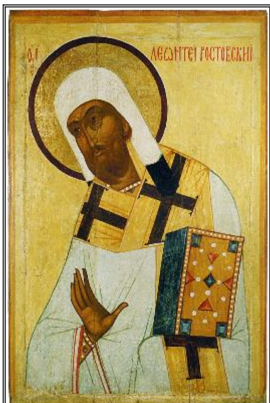
Свети Леонтий. Икона от Русия. 1-ва третина на XVI в.

С вятитель Леонтий, епископ Ростовский – один из выдающихся архипастырей XI века земли Русской. По словам святителя Симона, епископа Владимирского, которые можно считать достаточно достоверными, святой Леонтий был постриженником Печерского монастыря и по происхождению русский, а не грек, хотя родился в Константинополе. Промыслом Божиим будущий просветитель и апостол Ростовской земли проходил послушание под духовным руководством основателей русского монашества преподобных Антония († 1073) и Феодосия († 1074) Печерских. Он был первым епископом, вышедшим из монастыря в Киевских пещерах, воспитавшего многочисленных святителей Русской земли. «От того Печерского монастыря Пречи-