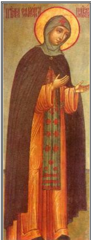
Преподобна Евфросиния. Икона от Русия. Края на XVII в.

В городе Полоцке жил князь, по имени Всеслав 3412 , имевший сына Георгия. От сего-то Георгия и родилась блаженная Евфросиния.