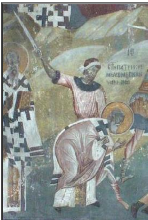
Мъч еничество на св. свешеномъченик Патрикий, епископ Пруски. Фреска от църквата "Благовещение". Грачаница, Косово, Сърбия. Около 1318 г.

Като се подготвял за посичането, Христовият мъченик и изповедник издигнал ръцете си към небето и казал: