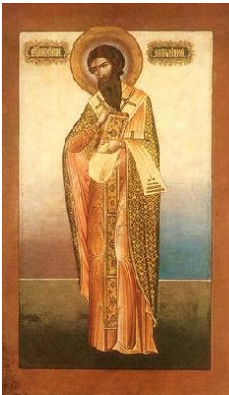
Святитель Георгий II Митиленский, епископ

3971 Кончина святых мучеников последовала ок. 303 г. Мощи святого мученика Вита одно время находились в Париже (в Сен-Дени), потом были перенесены в Корвей, в Вестфалии; ныне показываются в Праге.