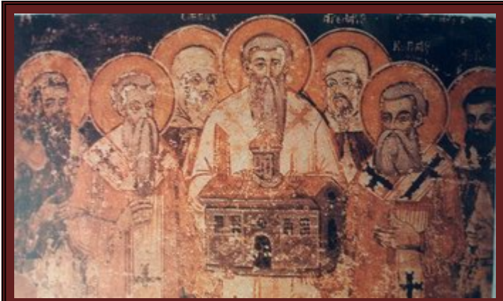
Равноапостолни учители славянски - от ляво на дясно - Наум, Климент, Сава, Методий, Ангеларий, Кирил, Горазд. Фреска от манастира на св. Наум в Охрид. 1806 г.

Като прекара четиридесет месеца в Моравия, той отиде да посвети учениците си. По пътя го прие Коцел, панонският княз, който, желаейки силно да усвои славянските книги, му даде около петдесет ученици да се учат на тях. И като му оказа големи почести, изпрати го нататък. А философът, проповядвайки евангелското слово без награда, не взе нито от Ростислава, нито от Коцеля ни злато, ни сребро, ни друго нещо, а само измоли от двамата деветстотин души пленници и ги освободи.