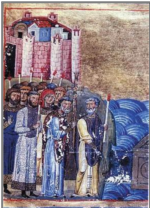
Свв. Константин-Кирил и Методий. Миниатюра от минологията на Василий II. Константинопол. 985 г.

С тези думи и с други по-силни ги посрами, остави ги и си отиде.