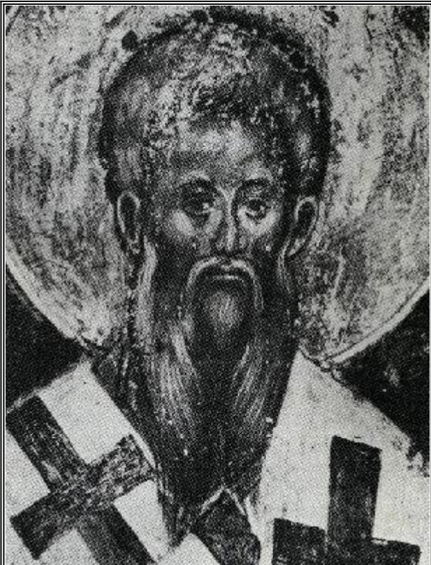
Св. Методий равноапостолен, учител Славянобългарски. Фреска от Сърбия - Каленич. XV в.

Б лагият и всемогъщ Бог, Който е привел всичко от небитие в битие - и видимо, и невидимо, го е украсил с всякаква красота, която човек, като съзерцава и размисля, може донейде да проумее и да познае Оногова, Който е създал такива дивни и многобройни дела. Защото “от величието и от красотата на творенията чрез размисъл се познава и техният Творец”, Когото възпяват ангелите с трисвети гласове и Когото всички православни люде славим в Света Троица - тоест в Отца, Сина и Светия Дух, три Ипостаси, Които можем да наречем три Лица, но в едно Божество. Защото преди всички времена, и срокове, и години, Сам Отец, над всеки разум и над всяко ангелско разбиране, е родил Сина, както казва Премъдростта: “Преди планините да са били поставени.” А и самото Слово Божие, Което в последните години се въплъти