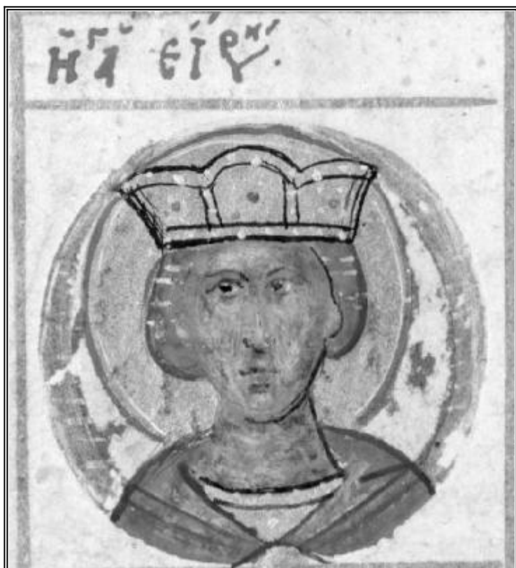
Мъченица Ирина. Миниатюра. Атон (Иверски м-р). Края на XV в.

и въплътил безсеменно от Пречистата Приснодева Мария и живял с хората, вършейки безброй чудеса: дарувал зрение на слепи, очиствал прокажени, възкресявал мъртви и повдигал разслабени. Евреите поради завист Го разпънали по Негово собствено произволение - за да пострада за нашето спасение. Но след смъртта и погребението Той възкръснал на третия ден със силата на Своята Божественост, възнесъл се на небето и седнал отдясно на Бога Отца, изпратил на учениците Си Светия Дух и ги пратил по земята, за да просветят помрачените духом, да обърнат заблуждаващите се и да спасят погиналите; защото Той желае спасението на всички и милостта Му към човешкия род не оскъднява во веки.