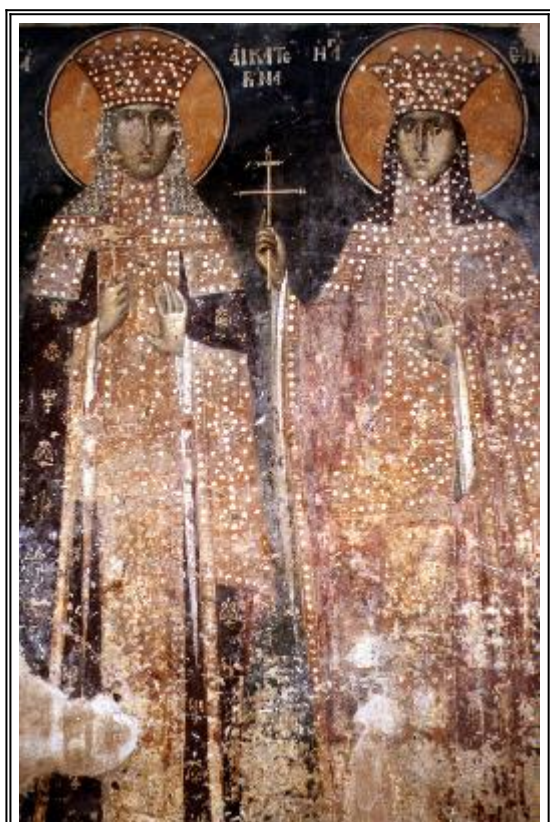
Великомъченици Екатерина и Ирина

- Велик си Ти, Боже на Ирина! Помилвай ни по Твоята велика милост! Ти си наш Бог, силен и крепък, творящ чудеса, дивни и преславни!