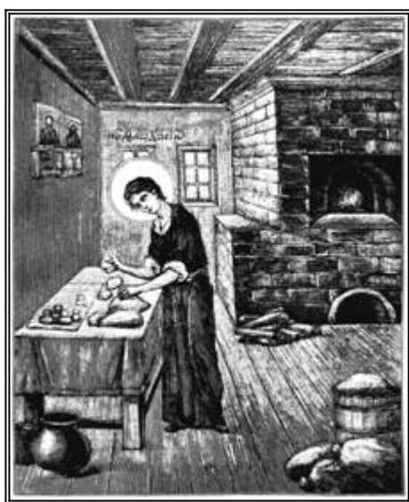
Отроческите трудове на преп. Теодосий в света

Виждайки, че често пъти не служат Божествена Литургия заради недостиг на просфори, той много скърбял за това и решил по своето смирение сам да прави това дело, и сторил така. Започнал той да купува пшеница, да я мели със своите ръце, да пече просфори и част от тях занасял в църквата, а останалите продавал; и колкото пари му оставали в повече, давал на бедните, а с останалите отново купувал пшеница и правел просфори. Такава била волята Божия: от чистия отрок да бъдат принасяни в храма чисти просфори. В тази работа той прекарал две години или повече.