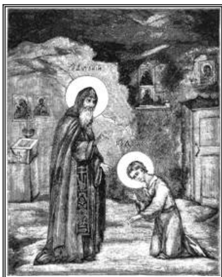
Младият Теодосий идва при св. Антоний

поклонил до земята, за да го благослови старецът. Преподобни Антоний го благословил и наредил на блажения Никон, който бил свещеник и опитен черноризец, да го постриже. И той, като взел блажения Теодосий като незлобиво агне, постригал го по обичая на светите отци и го облякъл в иноческа одежда на 24-тата му година, при благоверния княз Ярослав Владимирович.