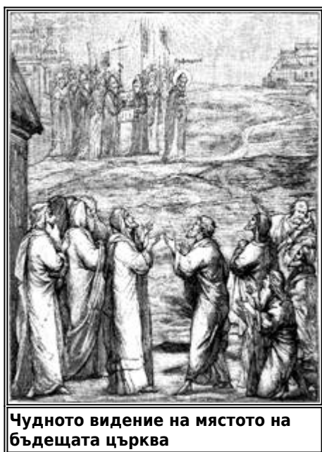
Чудното видение на мястото на бъдещата църква

пеене и молитва, те се върнали назад и отново с пеене влезли в старата църква. Това видение видели не един, не двама, но много хора и разказвали за него. Тъй като там нямало нито един от братята, те разбрали, че видели ангели – така влизащи и излизащи, и поради това прославили Бога, Който прославял това място по молитвите на преподобния Теодосий, и казвали с патриарх Яков: „Господ е на това място... Колко е страшно това място! Това не е нищо друго, освен дом Божий, това са врата небесни” (Бит. 28:16-17).