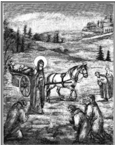
Смирението на преп. Теодосий

Всичко това разказал на братята самият този отрок, а преподобният не говорил за това на никого, но постоянно учел братята, че инокът не трябва с нищо да се превъзнася, а трябва да бъде смирен и да счита себе си по-долу от всички. Той ги учел да имат и на външен вид смирение, да ходят с положени кръстообразно на гърдите ръце и при среща да се покланят един другиму, както подобава на иноци. А най-много ги поучавал той на смирение в това – за всяко дело първо да вземат благословение от старшия, понеже, казвал той, който сее така делата си в благословение, в благословение и ще пожъне от тях сладък плод. И по следния начин показал той силата на това поучение.