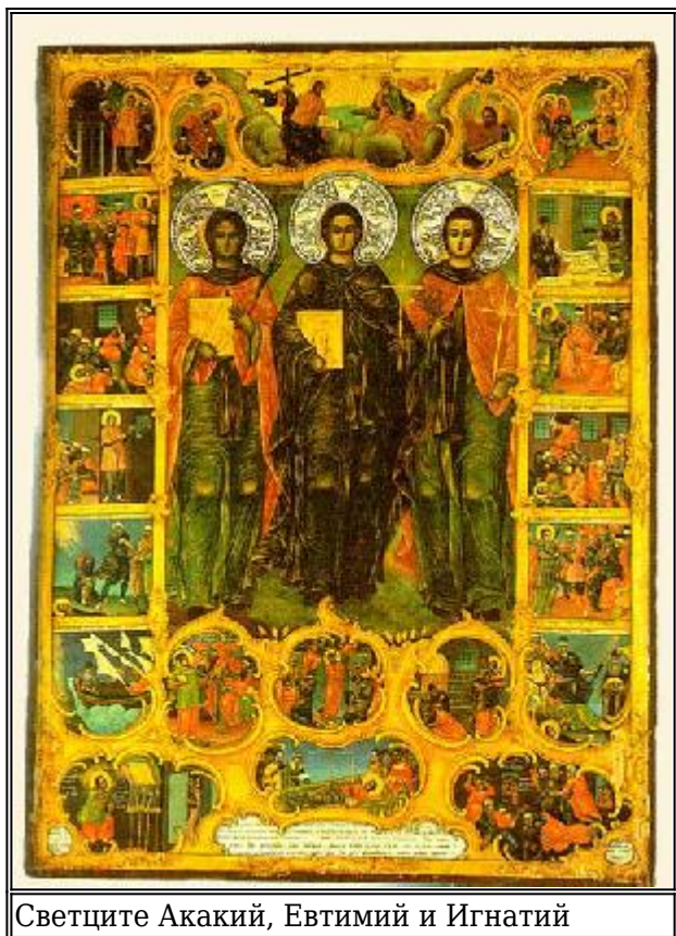
Светците Акакий, Евтимий и Игнатий

П реподобномъченик Акакий, в светото кръщение Атанасий, бил роден в българското село Ново село (по гръцки Неохори) до град Солун. Поради бедност родителите му се преселили в град Серес. Още деветгодишен те го дали да учи занаят при един обуцар. Но обуцарят така жестоко биел момчето всеки ден, щото веднъж, на Велики петък, то не издържало и обляно в сълзи избягало на улицата. За нещастие, две туркини го срещнали, поласкали го, въвели го в своя дом, нахранили го и така го объркали с хубавите си думи, че го убедили да се откаже от Христа. Тогава го взел при себе си градският бей, извършил над него обряда на мохамеданското обрезање, осиновил го и го обикнал заедно със жена си като роден син.