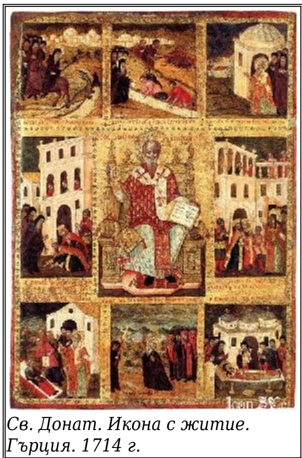
Св. Донат. Икона с житие. Гърция. 1714 г.

С вети Донат живял през царуването на император Теодосий Велики и бил епископ на град Еврия, който се намирал в днешния Епир. Наблизо край този град имало едно място, наречено Сория, където имало извор на вода. Ако някой пийнел вода от извора, веднага умираше в страшни мъки. Епископ Донат научил за това и отишъл там със своите клирици.