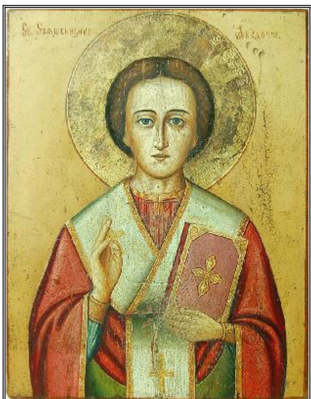
Свети Теодот Анкирски. Икона от Росия, края на XIX в.

Страдание на свети мъченик Теодот и на седемте свети девици: Фаина, Клавдия, Матрона, Текуса, Юлия, Александра и Евфрасия (303 г.)