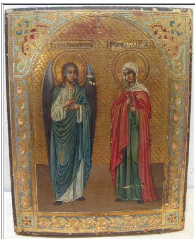
Ангел Хранител и мъченица Калерия