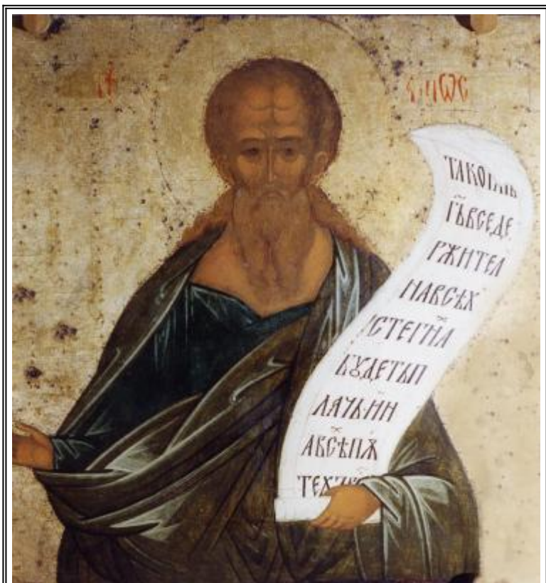
Св. пророк Амос. Икона от Успенския събор на Кирило-Белозерския манастир. 1497 г.

В памет на свети пророк Амос (VIII в. пр. Р.Х.)