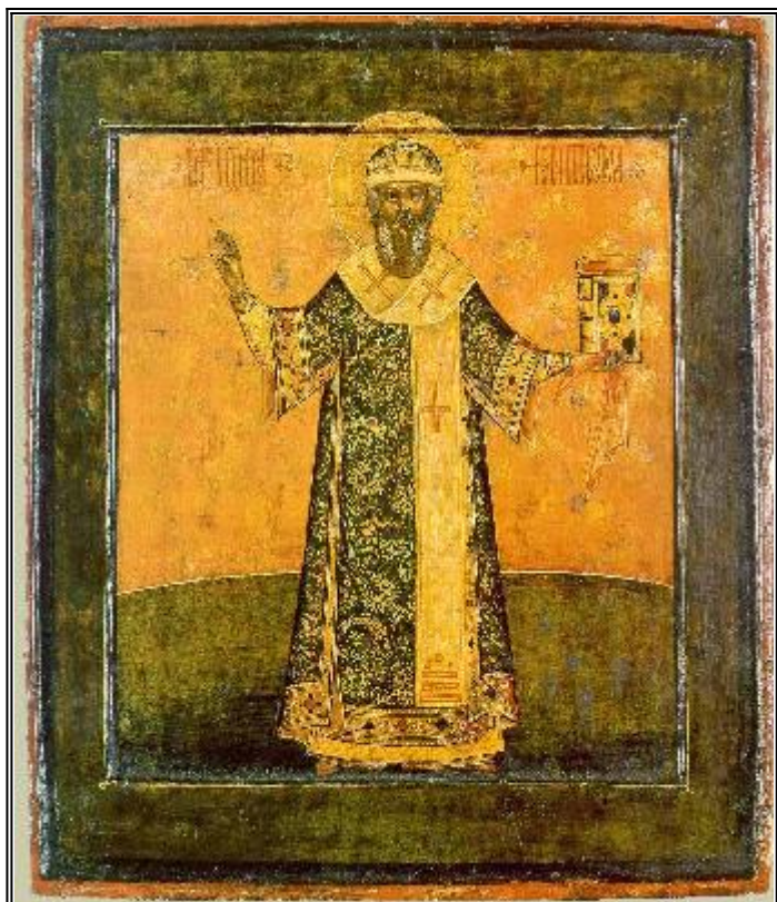
Митрополит Иона Московски. Икона от църквата "Апостол Филип" (събор на Дванадесет Апостола) Московския Кремъл. 1690 г.

С вятой Иона был родом из города Галича, который находится около Казанской земли 2305 . Он родился от благочестивого отца, по имени Феодора, и в двенадцатилетнем возрасте в одном из монастырей Галичской земли облекся во иноческий образ; затем он пришел в город Москву, в Симонов монастырь 2306 , где долго трудился в монастырских послушаниях.