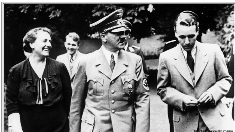
Адолф Хитлер с Унифред Вагнер и Виланд Вагнер, Волфганг Вагнер е на заден план, при откриването на фестивала в Байройт през юли 1938 г.

Гост на същия фестивал и също така добър приятел на наследниците в семейство Вагнер е и самият „фюрер“: