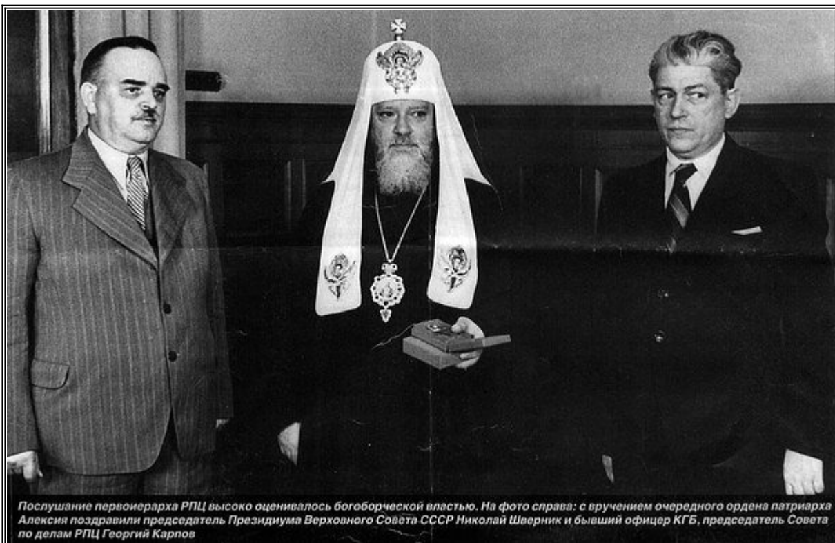
Послушание първоиерарха РПЦ високо оценявалось богоборческой властью. На фото справа: с вручением очередного ордена патриарха Алексея поздравили председатель Президиума Верховного Совета СССР Николай Шверник и бывший офицер КГБ, председатель Совета по делам РПЦ Георгий Карпов

Послушанието на първоиерарха на РПЦ е високо оценено от богоборческата власт. Виждаме връчване на поредния орден на патриарх Алексей, поздравен от председателя на Президиума на Върховния Съвет на СССР Николай Шверник и бившия офицер от КГБ, председателя на Съвета по работата на РПЦ Георги Карпов