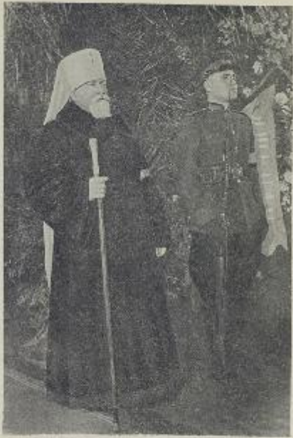
ПРЕДСТАВИТЕЛЬ РУССКОГО ПРАВОСЛАВНОГО ЦЕРКВИ МИТРОПОЛИТ НИКОЛАЙ В ПУХОВСКОМ КАРМАНЕ У ГРОБА И. В. СТАЛИНА

Представителят на РПЦ митрополит Николай в почетен караул при гроба на Сталин