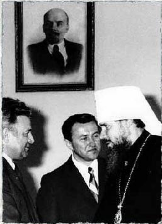
Август 1980 г. Алексей Ридигер, митр. Ленинградский, в Смоленском областном комитете Коммунистической партии Советского Союза на приеме.

Патриарх Сергей за социализма: „Този строй не само че не е противен за християнството, но и е подходящ за него повече от всичко друго“