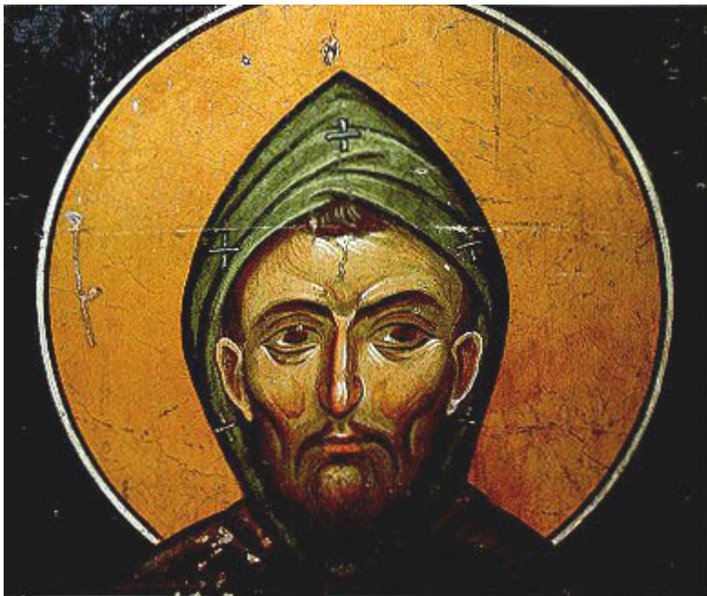
Преподобни Гавриил Лесновски (XI в.)

житие на светия отшелник стигнала до александрийския префект, поставен от императора Деций, гонителя на християните. Когато застанал на съда, свети Пансофий изобличил лъжливостта на езическите учения с преданията на самите езичници за техните богове и с необорими доказателства изповядал, че Христос е Бог, и така посрамил високомерието на мъчителя. Заради това Христовият изповедник бил подложен на жестоко бичуване и приел мъченическия венец.