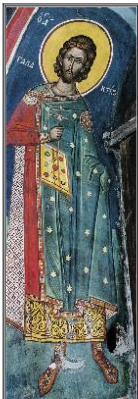
Мъченик Галактион. Фреска. Атон (Дионисиат). 1547 г.

Житие и страдание на светите преподобномъченици Галактион и Епистима (III в.)