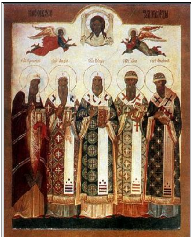
Събор на Московските светители Ермоген, Алексий, Петър, Иона и Филип

К ато трите велики стълба на православието - Василий Велики, Григорий Богослов и Иоан Златоуст, които запазили непокътнатото зданието на древната Източна Църква от нападенията и гоненията на еретиците, тримата велики светители на Московската църква Петър, Алексий и Иона съхранили православието в светата руска земя от многобройни