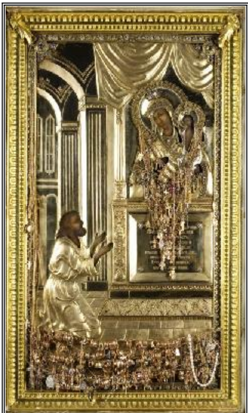
Чудотворна икона "Неожданна радост".