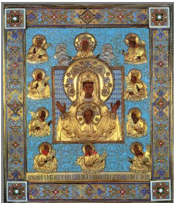
Първообраз на чудотворната икона на Пресвета Богородица Курско-Коренна "Знамение"

К урская икона «Знамение» Божией Матери — одна из древнейших икон Русской Церкви. В XIII веке, во время татарского нашествия, когда все Русское государство испытывало величай-