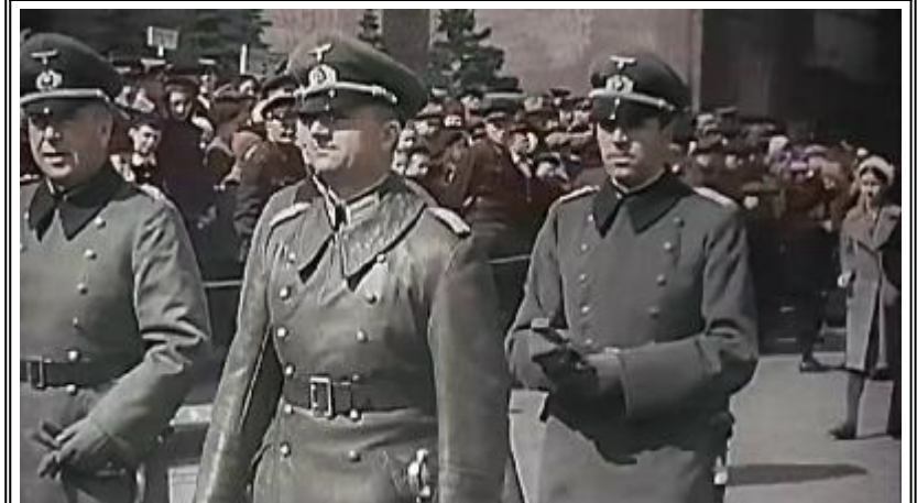
Семьон Тимошенко поздравява гостите от приятелска нацистка Германия - парада по случай 1 май 1941 г.