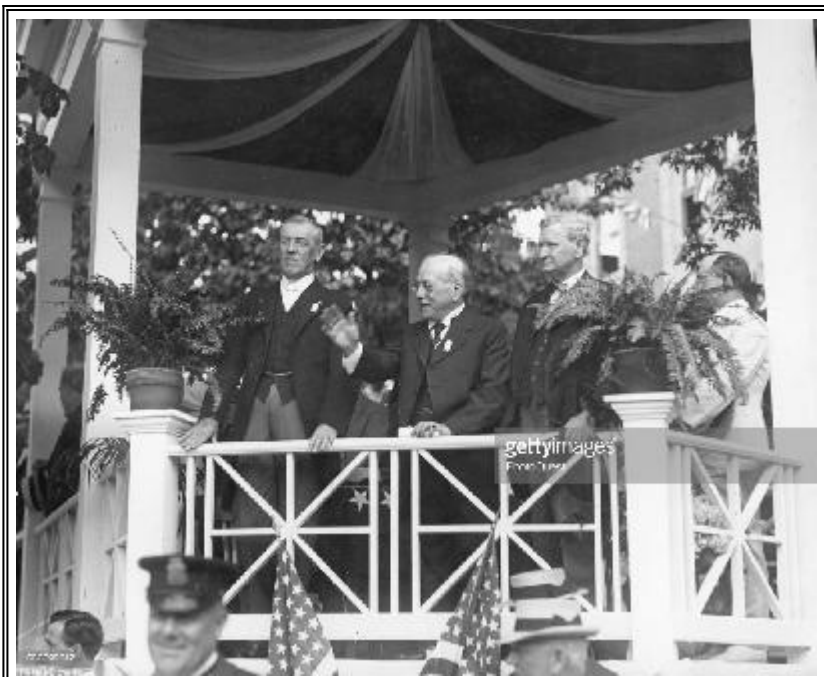
Американския президент Удроу Уилсън празнува 1 май

Всъщност тогава е отбелязана 110 годишнината на друго паметно за световния елит събитие: на тази дата, през