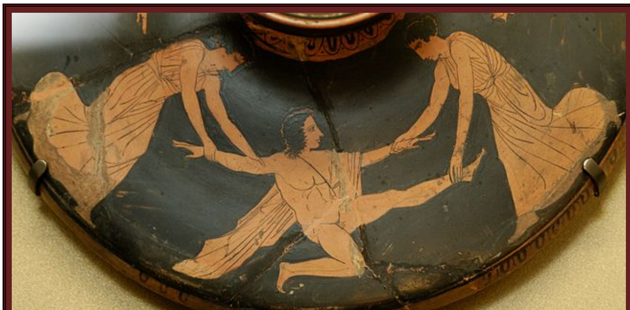
Пентей разкъсван от вакханките Агава и Ино

В древногръцката митология, която е в основата на римските и други европейски езически легенди, можем да срещнем други, изглеждащи вече познати образи – т. нар. „вакханки“ (гръцки: Βάκχαι) - развратни, диви и жестоки жени, които представлявали свитата на бог Дионис и участват в неговите пиянски оргии, с които привличат хората в техния култ (често срещана практика в езическия свят, практикувана активно и от неговите наследници - юдомасоните) . В град Тива, Дионис наказва с безумие местния цар Пентей, защото отказва да му служи. Тиванският владетел, облечен във вакхически дрехи, тръгва заедно с жените, за да види оргиите. Вакханките, сред които и Агава и нейните сестри, се нахвърлят върху Пентей и го разкъсват.