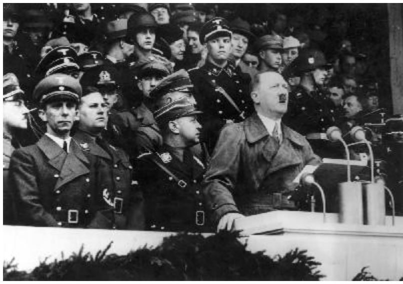
Хитлер 1 май 1936 г. Имперски трудов ден