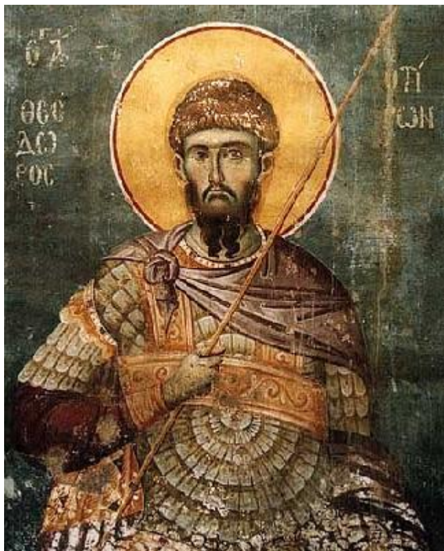
Страдание на свети великомъченик Теодор Тирон (306 г.)

02.03 по еретическия, †17 февруари по църковния календар - Св. великомъченик Теодор Тирон. Св. преподобни Роман Търновски. Св. Мариамна. Намиране на мощите на свети мъченик Мина Каликелад