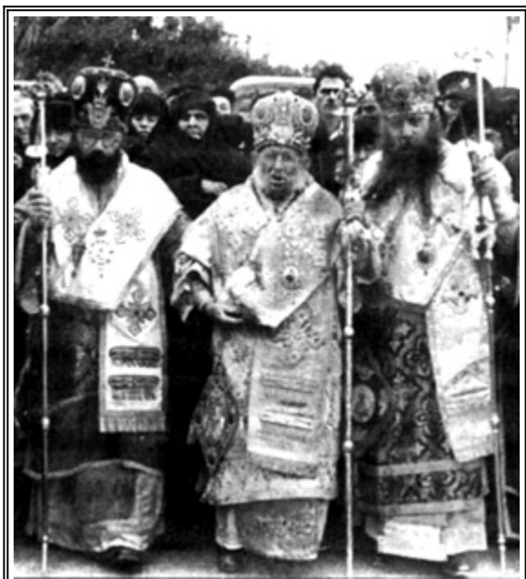
Богоявление 1950 г

На 15 септември 1949 г. Синодът на Епископите единодушно възлага на Преосвещени Матей сан Архиепископ. Той запазва този сан до смъртта си, с която ние ще завършим тази кратка биография.