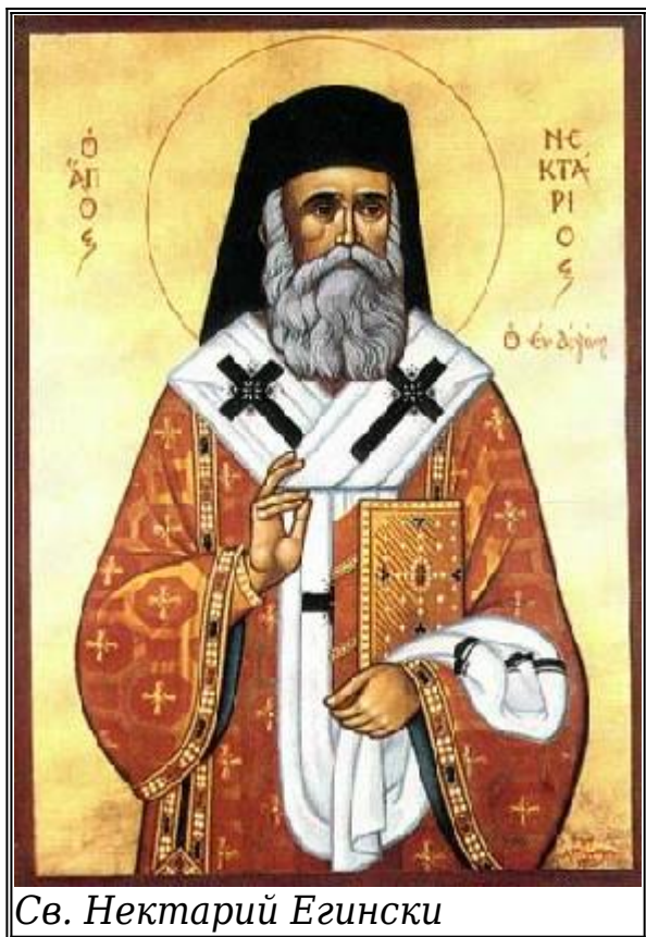
Св. Нектарий Егински

През 1910 г. отец Матей отива в училище Ризарион, ръководено от Свети Нектарий, епископ Пентаполски. Матей вече беше чувал проповедите на свети Нектарий по време на престоя си в Египет. Той знаеше също, че светецът основал манастир на остров Егина. Той е значително впечатлен от величествения и в същото време прост Свети Нектарий. Нектарий издигнал Матей в сан архимандрит. За спомен той му подарява своят епигонатий (палица), който се съхранява досега в църквата „Въведение на Пресвета Богородица“ на женския манастир в Кератея. Впоследствие те водят обширна кореспонденция.