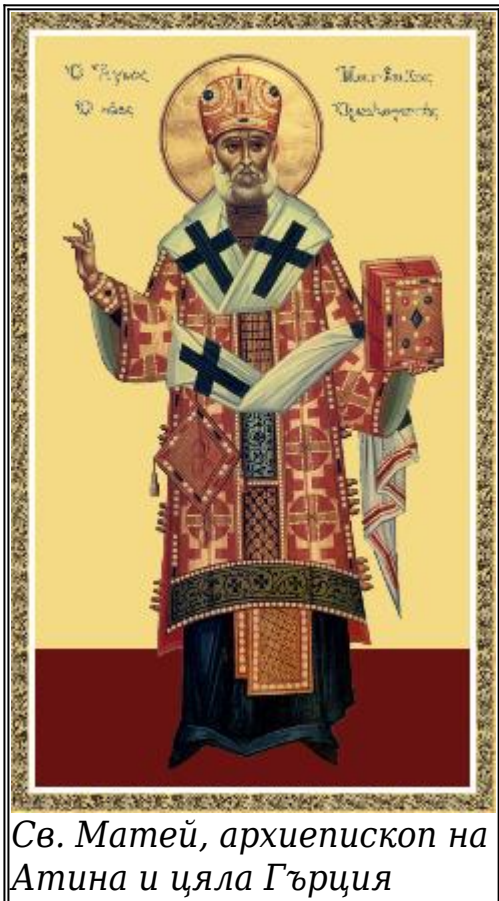
Св. Матей, архиепископ на Атина и цяла Гърция

Д нес , малкото останали православни хора по света наричат свети Матей Атински „новия Марк Ефески“!