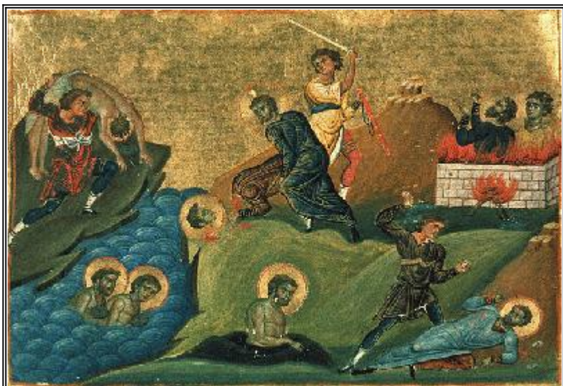
Свети мъченици от Никомидия. Миниатюра от минологията на Василий II. Константинопол. 985 г.

в геената.”, както е възвестено това от Божествения глас.